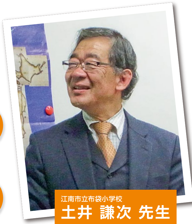
江南市立布袋小学校