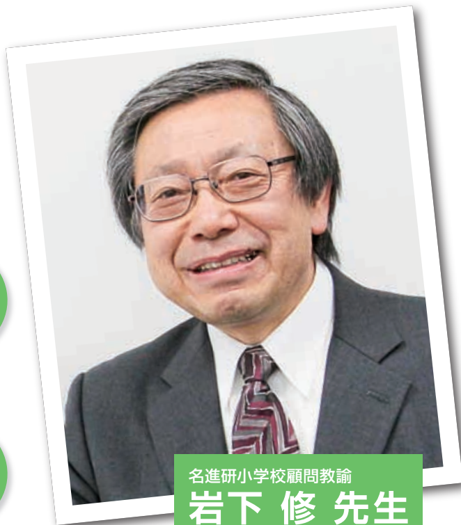
名進研小学校顧問教諭