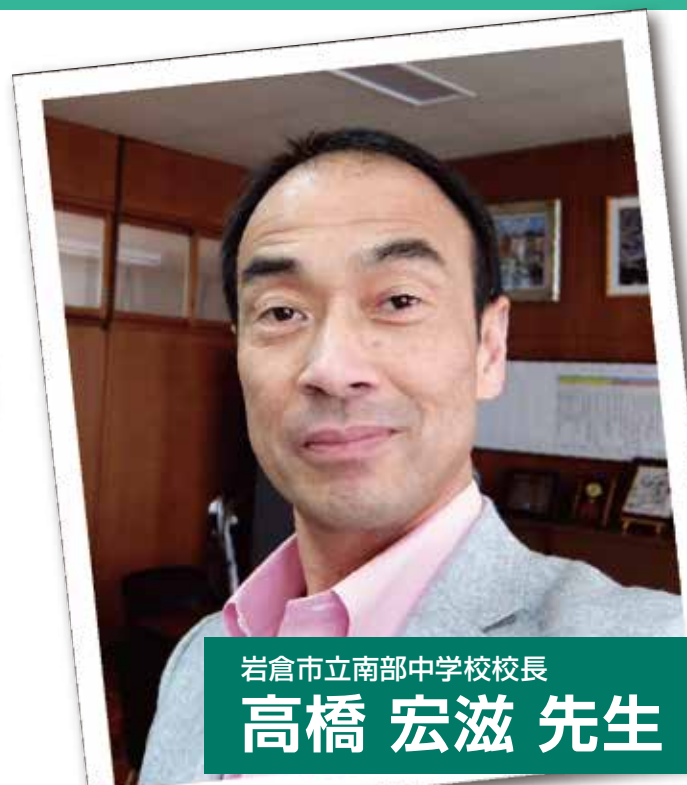
岩倉市立南部中学校校長