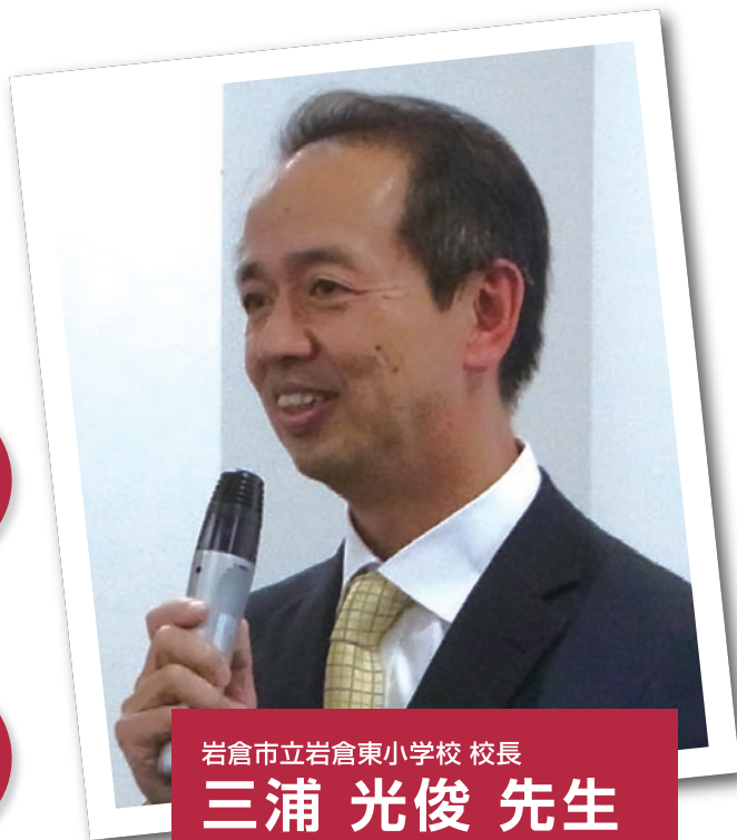
岩倉市立岩倉東小学校 校長