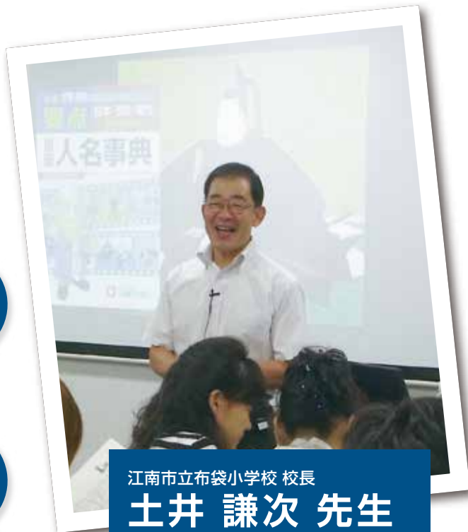
江南市立布袋小学校 校長