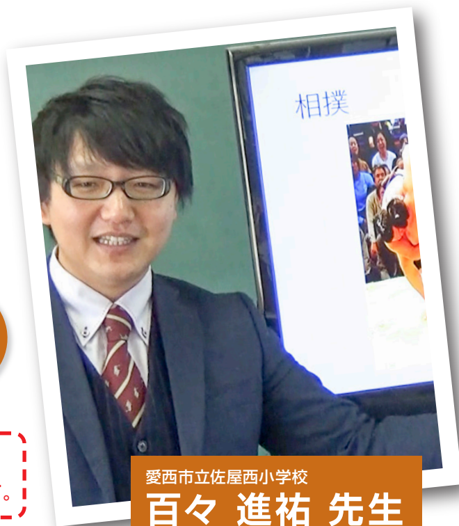
愛西市立佐屋西小学校

コロナウイルスの影響で中止となる場合がございます。 6/8(月)の時点でホームページにてご連絡をさせていただきます。