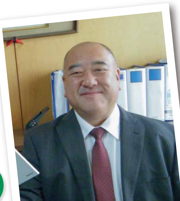
岩倉市立岩倉中学校

コロナウイルスの影響で中止となる場合がございます。 11/9(月)の時点でホームページにてご連絡をさせていただきます。