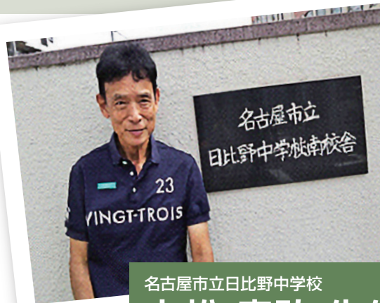
名古屋市立日比野中学校