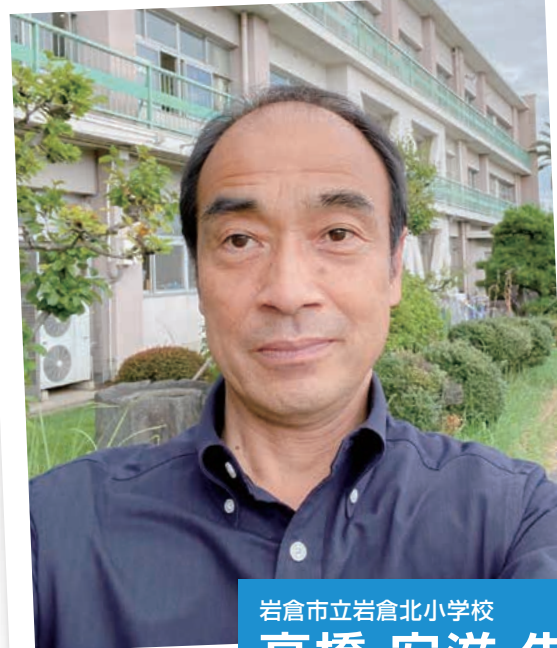
岩倉市立岩倉北小学校