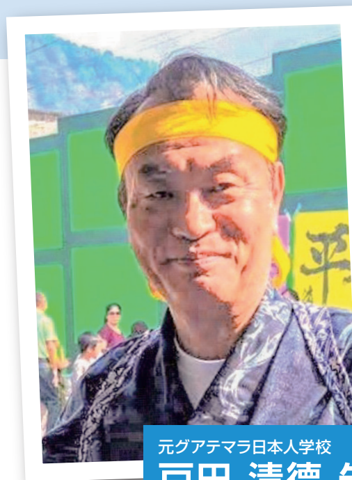
元グアテマラ日本人学校