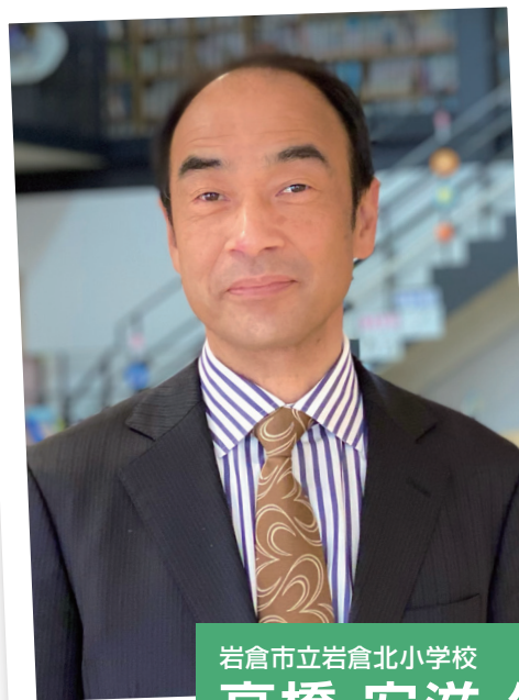
岩倉市立岩倉北小学校