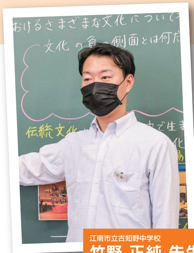
江南市立古知野中学校

私たちは一人一人、感じ方や考え方が異なります。一つの教材を通してみんなで語り合うところに、道徳のおもしろさがあります。今回は中学校の道徳教材を通して、一人一人が自分なりの答え(納得解)を見つけられる授業を作っていきたいと思います。