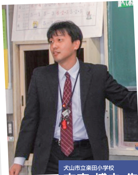
犬山市立楽田小学校