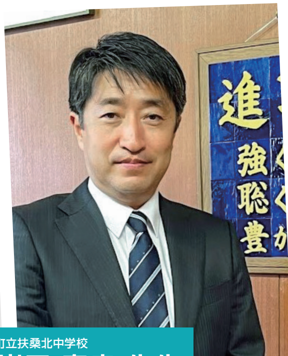
扶桑町立扶桑北中学校